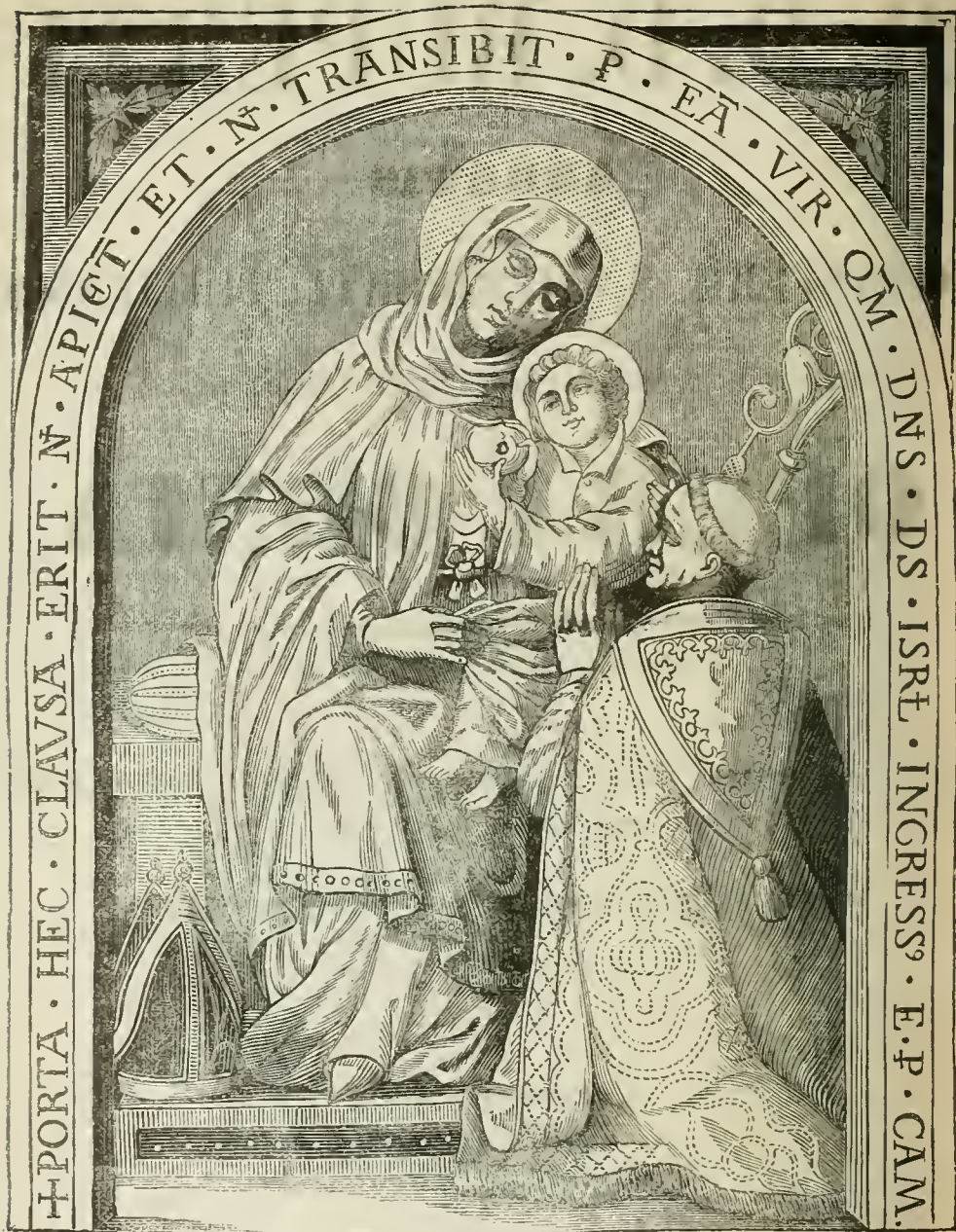
RUPERTUS S. Laurentii in suburbio Leodiensi Monachus (postea ABBAS TUITIENSIS) tardiori ingenio remedium a Virgine Matre, coram hac imagine lapidea, in ejusdem monasterii Ecclesia, impetrat anno MCXXI.